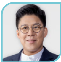
榮譽理事 Honorary Director 霍啟剛 JP Kenneth Fok Kai kong 香港藝術發展局 主席 Chairman of Hong Kong Arts Development Council 香港特別行政區 立法會議員 Members of The Legislative Council