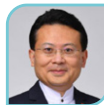
榮譽理事 Honorary Director 陳勇 SBS, JP Chan Yung 港區全國人大代表召集人 Convener of HK SAR deputies to the National People's Congress 香港特別行政區 立法會議員 Members of The Legislative Council