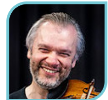
亞歷山大·特羅斯基