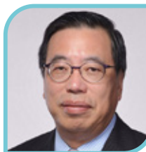
榮譽主席 Honorary Chairman 梁君彥 GBM, GBS, JP Andrew Leung Kwan Yuen 香港特別行政區 立法會主席 The President of the Legislative Council