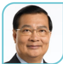
榮譽會長 Honorary President 譚耀宗 GBM, GBS, JP Tam Yiu Chung 第十三屆全國人民代表大會 常務委員會委員 Member of the 13rd Standing Committee of the National People's Congress