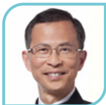
永遠榮譽主席 Lifetime Honorary Chairman 曾鈺成 GBM, GBS, JP Jasper Tsang Yok Sing 香港特別行政區第四至五屆 立法會主席 The President of the 4th - 5th Legislative Council