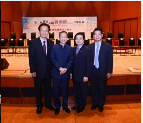
▲ 香港特別行政區立法會主席 曾鈺成 GBS JP (左二) 副主席古揚邦先生 (右一) / 藝術總監薛蘇里 教授 (左一)