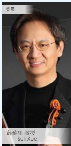
美國 薛蘇里 教授 Suli Xue