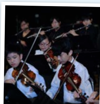
2012年優質教育展才華