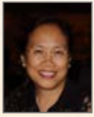
Kuei Pin Yeo

·波蘭青年管弦樂團藝術總監 ·何塞·奧古斯托·阿萊格裡亞國際小提琴比賽最高獎得主 ·助非爾德國際弦樂比賽2014哈爾濱評委