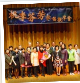
2015年桃李芬芳音樂會