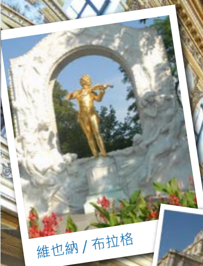
維也納 / 布拉格