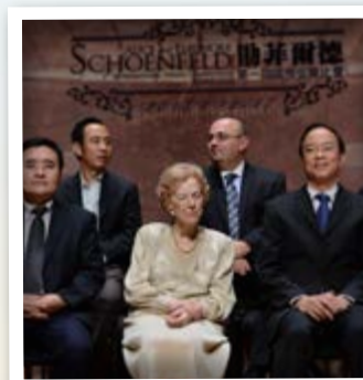
2013年助菲爾德國際弦樂比賽