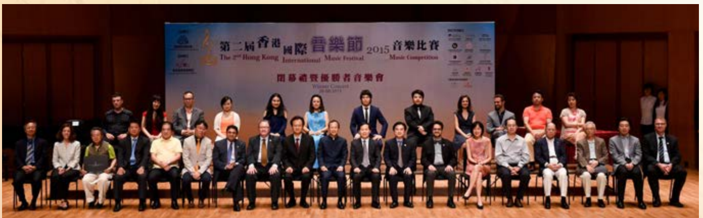
▲ 第二屆香港國際音樂節評委大合照