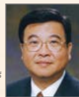
黃玉山 BBS JP

· 香港藝術發展局音樂組主席 · 香港民族音樂學會會長 · 中國音樂學院客座教授