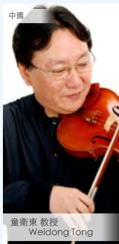
中國 童衛東 教授 Weidong Tong